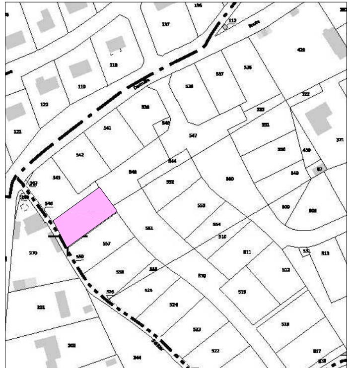
LOCALISATION DU LOT