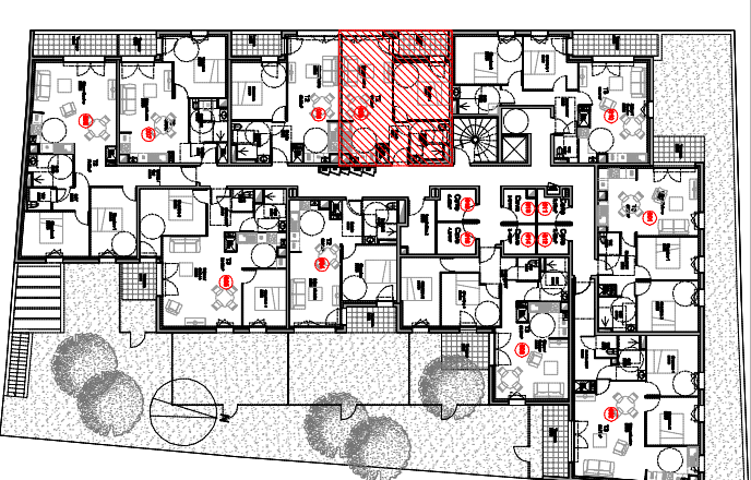
TABLEAU DES SURFACES HABITABLES