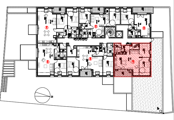
TABLEAU DES SURFACES HABITABLES