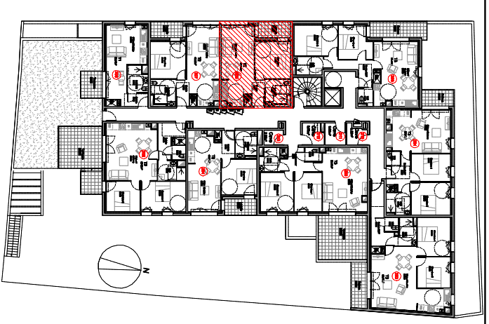
TABLEAU DES SURFACES HABITABLES