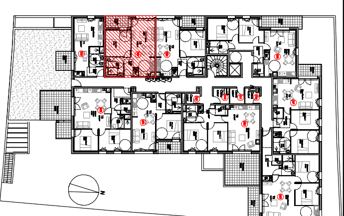
TABLEAU DES SURFACES HABITABLES