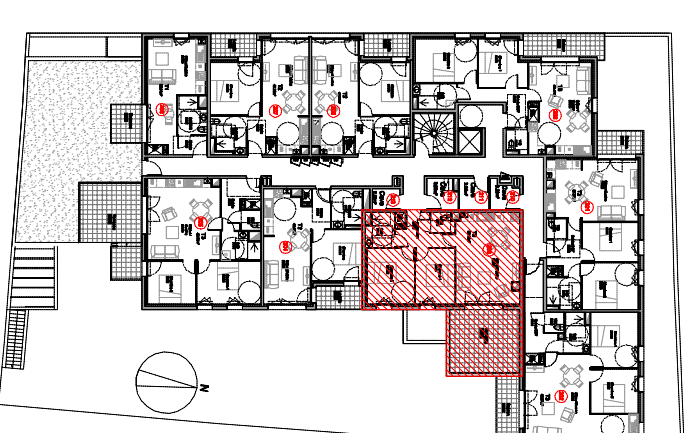
TABLEAU DES SURFACES HABITABLES