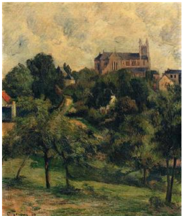
Paul Gauguin, L'église Notre Dame des Anges à Bihorel, huile sur toile, 1884